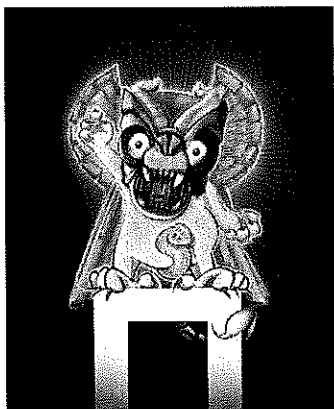
Pazuzu (Progetto per il Castello di Rivoli) (Pazuzu – Project for Castello di Rivoli), 2007 disegno digitale / digital drawing Courtesy dell'artista / of the artist

Castello di Rivoli, 6 maggio / May 2008 – 27 luglio / July 2008